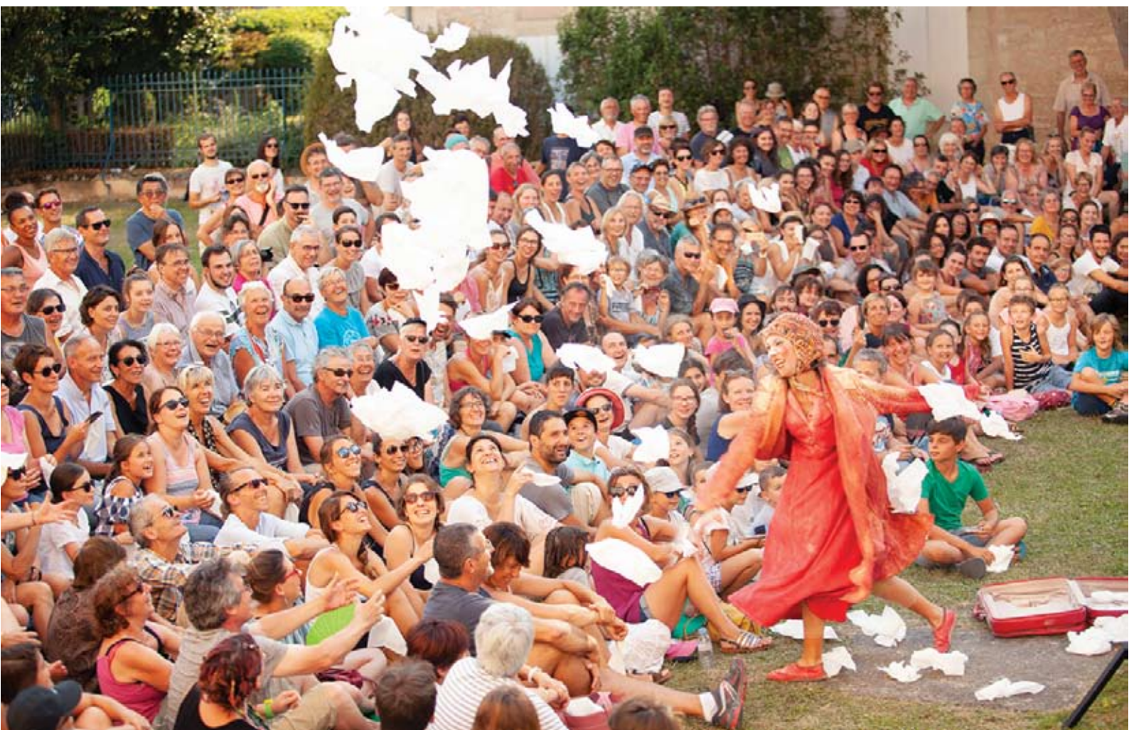
*Festival Mimos, Perigueux (Francia)

ROJO ja es troba a la seva segona temporada el 2018, girant per festivals i circuits molt diversos (Kaldearte, Entrepayasos, IberEscena, Circaire, Festival de Payasas Circ Cric, Mimos, Cucha Pirmavera, CiudaDistrito, MataderoMadrid, Festival Contemporaneo de Lazarillo, Centro Cultural Pilar Miró, Festa del Prat Solidari, Minipop, Festiclown, Veranéa Tetuán i Muestra de Teatro Cómico de Cangas, entre altres)