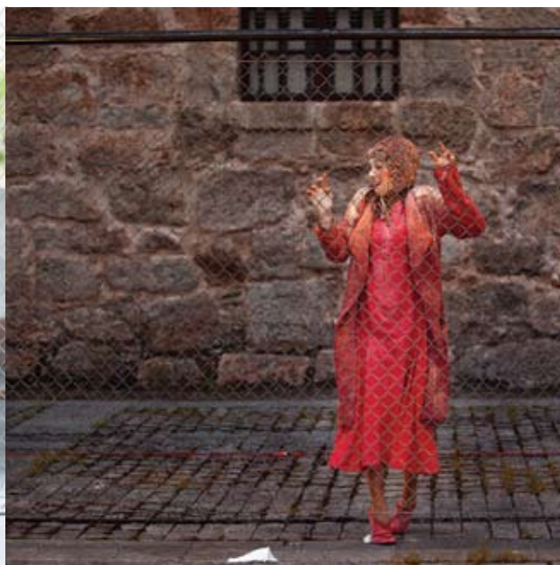
*Escenario Vivo, La Rioja.