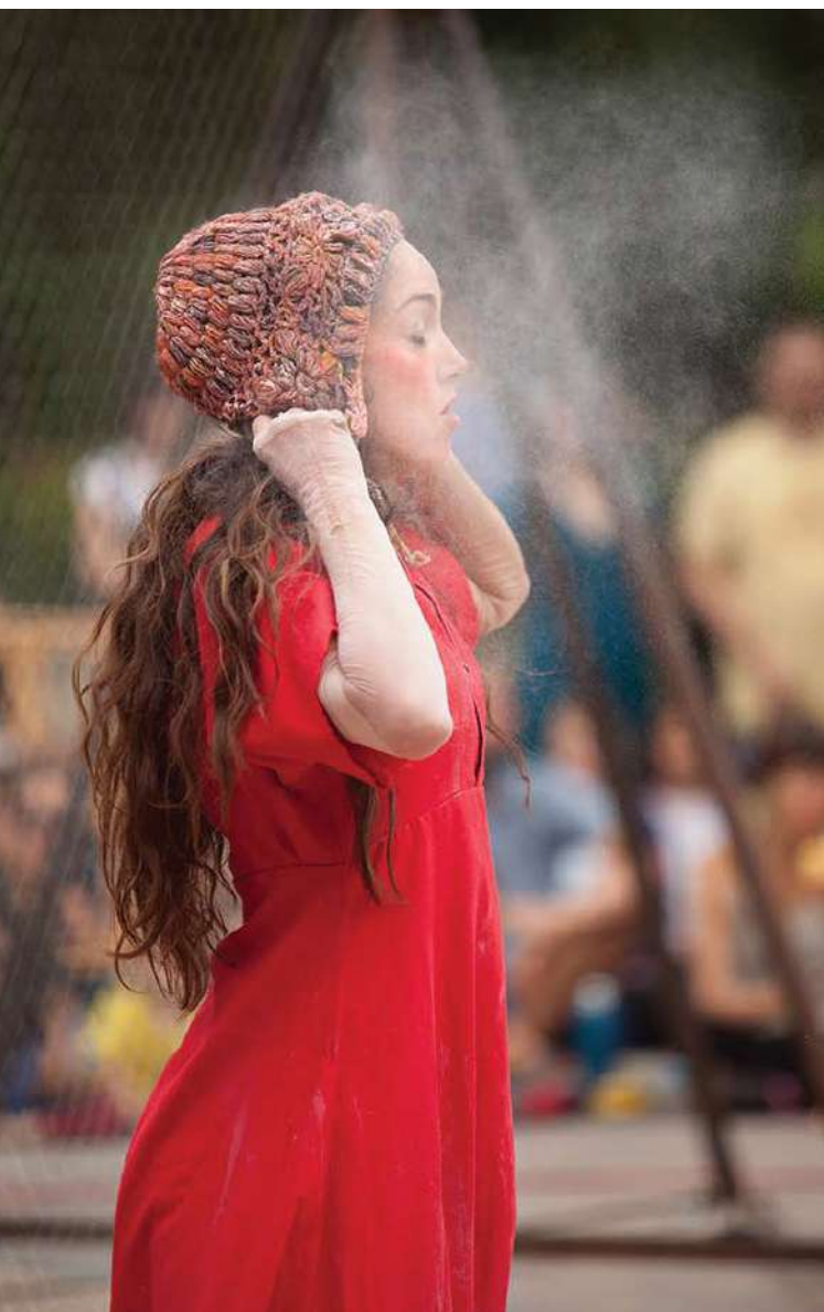
*Festival de payasas CircCric

Musique : Piano Novel et Proyecto Voltaire