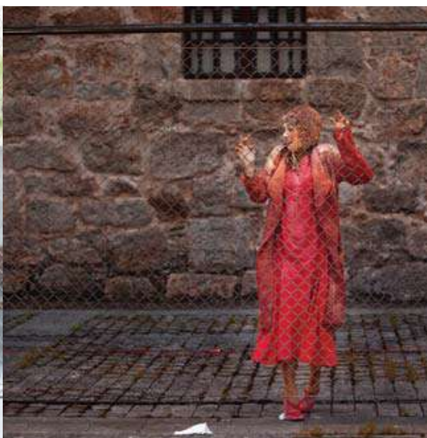
*Escenario Vivo, La Rioja.