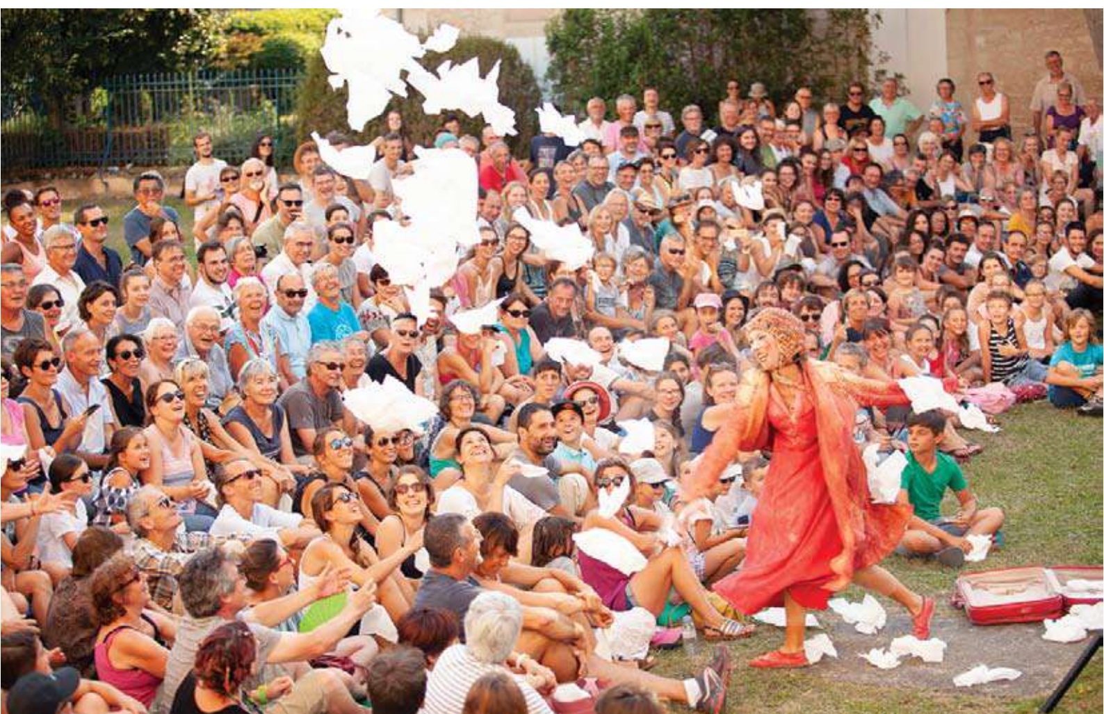
*Festival Mimos, Perigueux (France)

Pour sa deuxième saison en 2018, ROJO est en train de tourner au sein des festivals et circuits très divers (Mimos, Kaldearte, Entrepayasos, Iberescena, Circaire, Festival de Payasas del Circ Cric, Cucha Primavera, Ciudad Distrito, Matadero de Madrid, Festival Contemporáneo de Lazarillo, le centre culturel Pilar Miró, Festa del Prat Solidari, Minipop, FestiClown, Veranea Tetuán et Muestra de Teatro Cómico de Cangas, parmi d'autres).