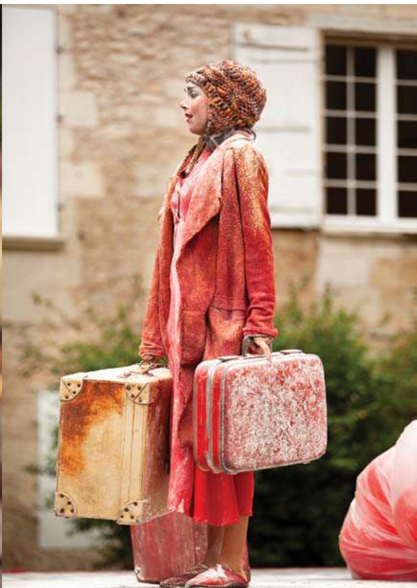
*Festival Mimos, Perigueux (France)